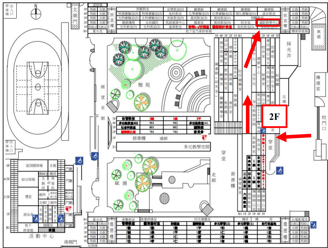
臺北市立西松高級中學 110 學年度校舍配置圖 ( 1 1 0 . 0 8 )