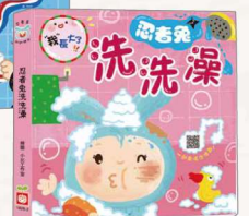
《我長大了：忍者兔洗洗澡》