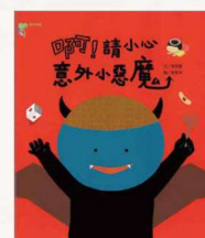
《啊！請小心意外小惡魔》