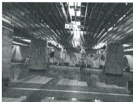
東區地下街第2廣場