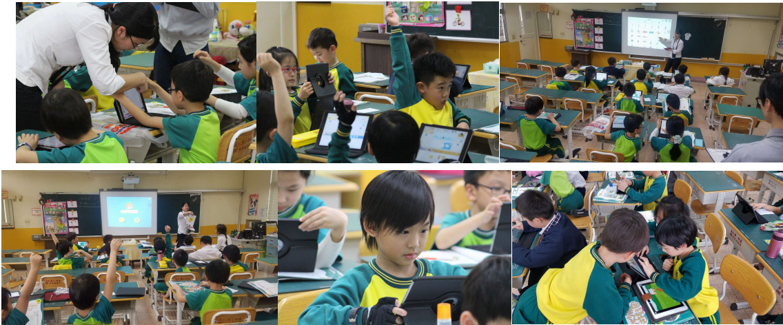
台北市私立光仁小學上課實況