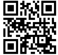
臺北市中山國小 QR Code