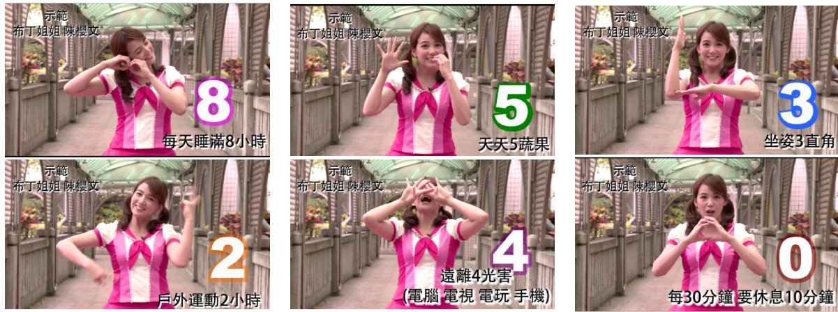
圖：護眼密碼 853240 遊戲教學示範影片截圖