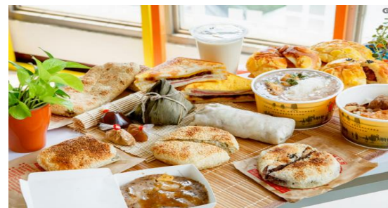
初嚐美味-飽餐市集