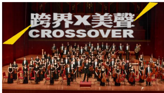
晨曦音樂會-跨界演出