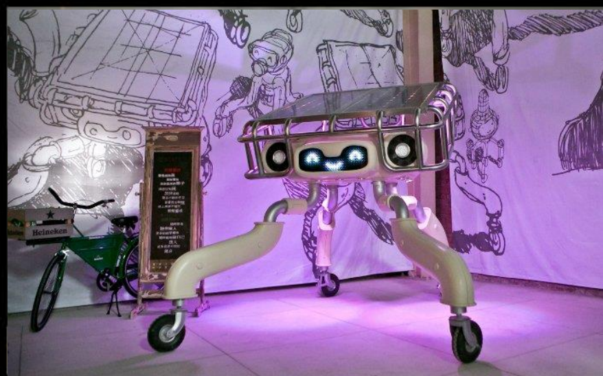
或《光虫》以聲光節奏呼喚著觀眾