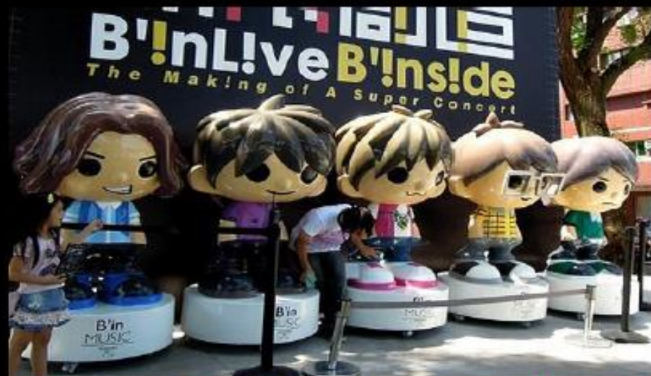
Binlive 五月天大型公仔主題創作貨櫃