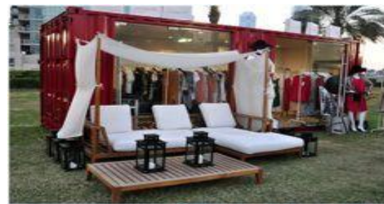
文化主題策展-貨櫃裝置