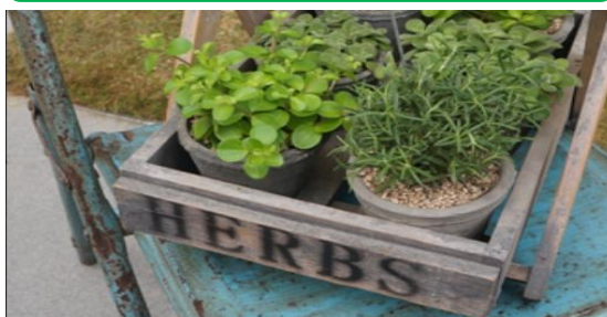
初點自然-好農市集