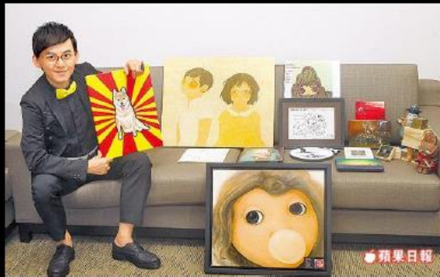
跨界王-黃子佼藝術創作基地